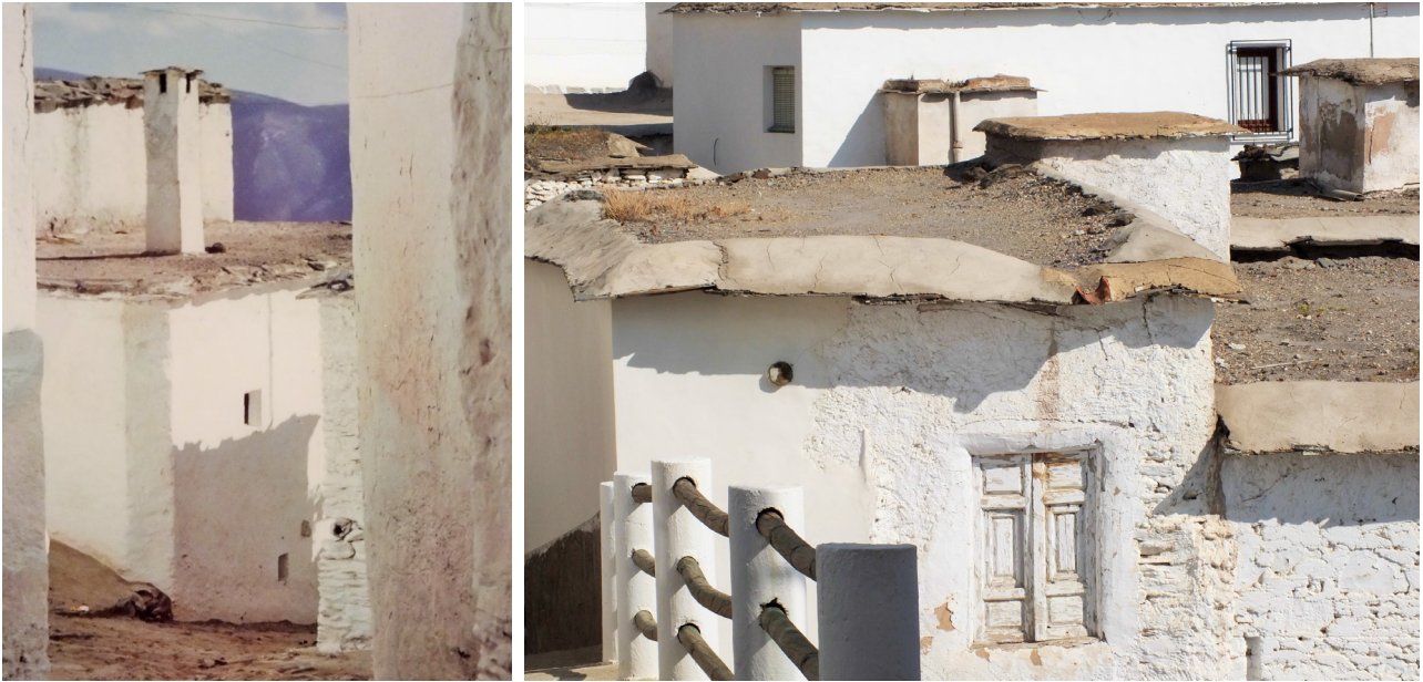
Fotoensayo Alpujarras . Gema Rocío Guerrero Higuera. 2014. Derecha: B. Rudofsky. Alpujarra (Detalle), 1972. Izquierda: Gema G. Guerrero Higuera. Alpujarras # 3. 2014.

2. Sreets for people . En la calle está la diversión. 28